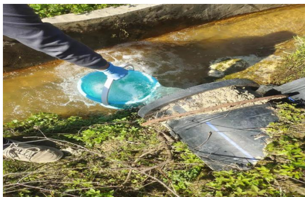
1 号尾矿库废水排口

注：“<”表示检测结果低于检出限；“*”表示外包检测项目，检测结果由宁波远大检测技术有限公司提供，报告编号《远大检测 SW22030304》，证书编号 161120341379；发证日期：2016. 09. 18；有效期至：2022. 09. 17；标准限值指执行《污水综合排放标准》（GB8978-1996）表 4 一级标准。