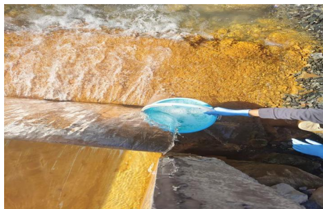
2 号尾矿库废水排口